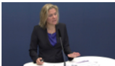
▪ ▪ Presentation av budgetpropositionen för 2015 23 oktober 2014