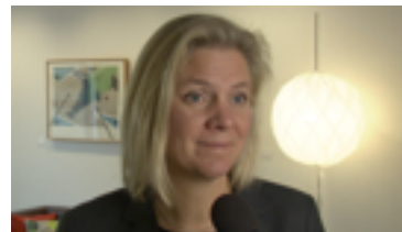
▪ ▪ Finansminister Magdalena Andersson om budgetpropositionen 2015 23 oktober 2014