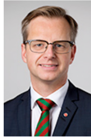
Mikael Damberg Närings- och innovationsminister