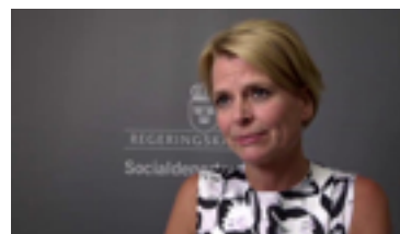
▪ ▪ Barn- och äldre- och jämställdhetsminister Åsa Regnér kommenterar budgeten för 2015 23 oktober 2014