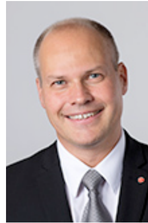
Morgan Johansson Justitie- och migrationsminister