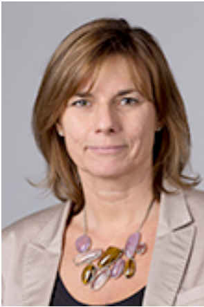
Isabella Lövin Biståndsminister