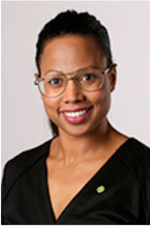
Alice Bah Kuhnke Kultur- och demokratiminister