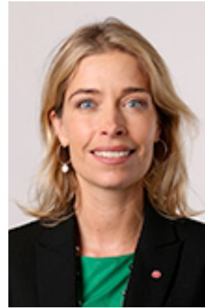
Annika Strandhäll Socialförsäkringsminister