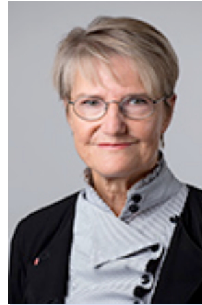
Kristina Persson Minister för strategi- och framtidsfrågor samt nordiskt samarbete