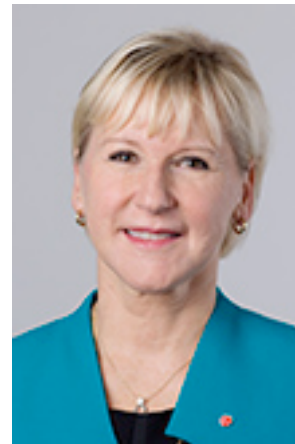
Margot Wallström Utrikesminister