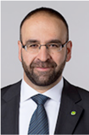
Mehmet Kaplan Bostads- och stadsutvecklingsminister