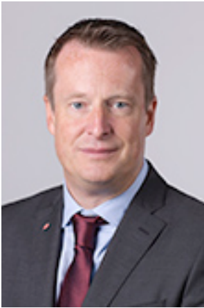
Anders Ygeman Inrikesminister