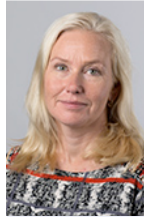
Anna Johansson Infrastrukturminister