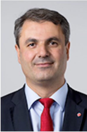
Ibrahim Baylan Energiminister