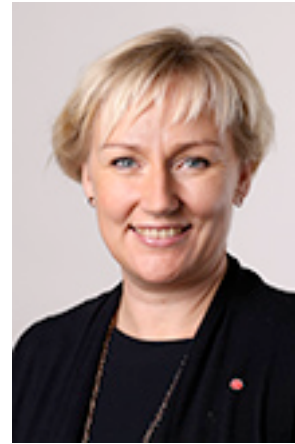
Helene Hellmark Knutsson

Minister för högre utbildning och forskning