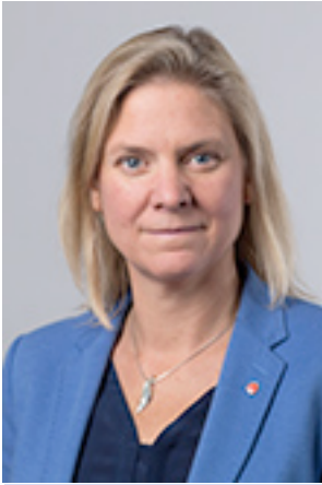
Magdalena Andersson Finansminister