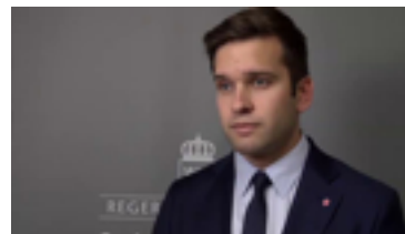
▪ ▪ Folkhälso-, sjukvårds- och idrottsminister Gabriel Wikström kommenterar budgeten för 2015 23 oktober 2014