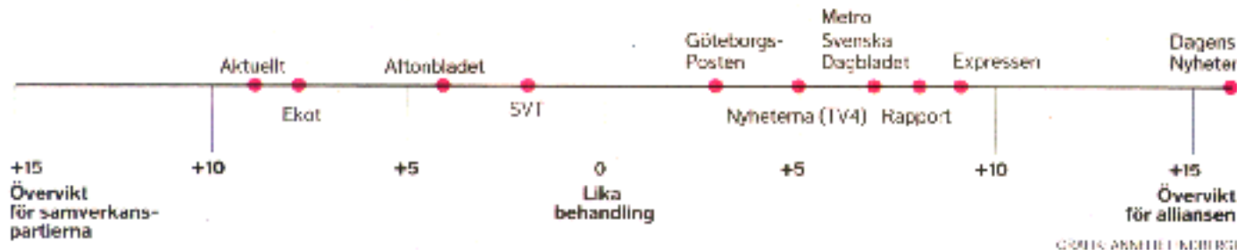
Mediernas partiskhet i riksdagsvalet. Indexet visar hur olika medier förhöll sig till de olika regeringsalternativen på nyhetsplats under valrörelsen 2006.

I åtta av elva undersökta nyhetsmedier behandlades alliansen mer gynnsamt än socialdemokraterna och samverkanspartierna. Den mest gynnsamma behandlingen fick alliansen i Dagens Nyheter och Expressen. Samverkanspartierna fick den mest gynnsamma behandlingen i Aktuellt och Ekot. Göteborgs-Posten och Aftonbladet hade den mest balanserade nyhetsbevakningen.